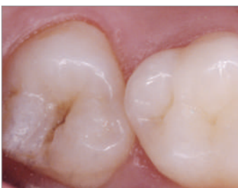
使用前の小窩裂溝