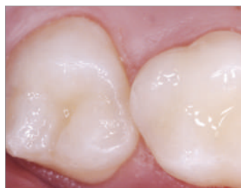
ウルトラシールXTプラスJにより小窩裂溝を塞ぐことでう蝕の予防が可能