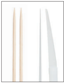
爪楊枝とオパールピックスの形状比較