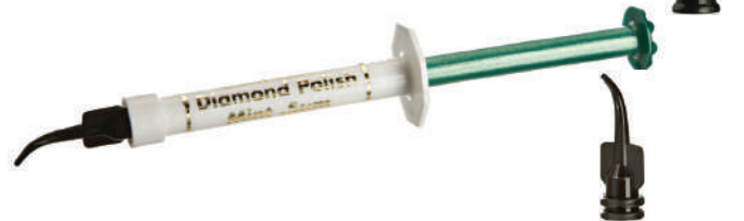
ブラックミニチップ