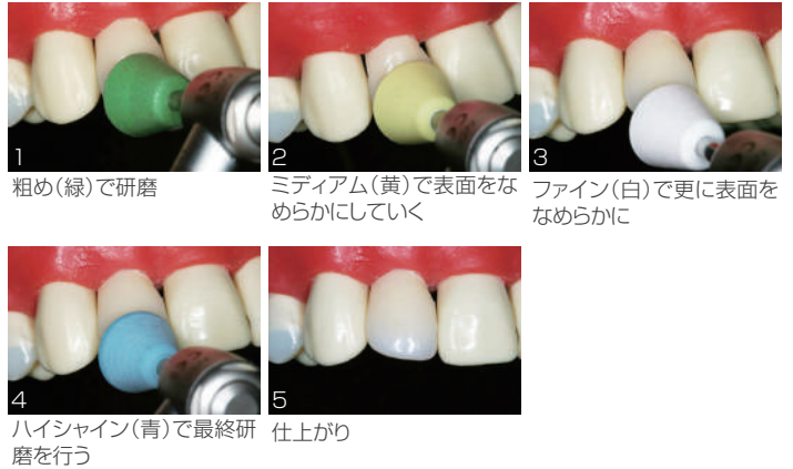
1 粗め(緑)で研磨 2 ミディアム(黄)で表面をなめらかにしていく 3 ファイン(白)で更に表面をなめらかに 4 ハイシャイン(青)で最終研 仕上げり 5 磨を行う