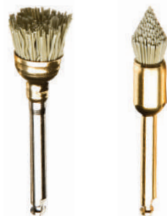
レギュラー ポイント