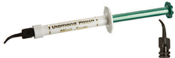
ブラックミニチップ