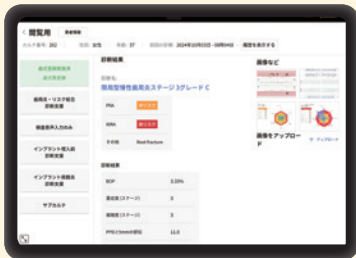
歯周炎診断を提案