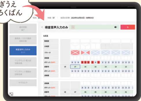
マイクなし・ハンズフリー音声入力

主催: K.O. Dental corp. www.kodental.co.jp